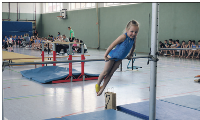
Der offizielle Auftakt zu den Kreisjugendspielen 2022 wurde mit dem Wettkampf der jungen Turnerinnen und Turner vollzogen.

Erfolg und freute sich über die große Zahl an Aktiven. In insgesamt 19 Sportarten werden Kinder und Jugendliche noch bis zum 14. Juli um Bestleistungen und gute Platzierungen wetteifern. Die Kreisjugendspiele gelten als der größte sportliche Kinder- und Jugendwettbewerb des Landkreises und verfolgen nicht zuletzt das Ziel, die Teilnehmer auch außerhalb der Schule für den Sport zu begeistern und sie auch dazu zu ermuntern, sich einem der zahlreichen Vereine anzuschließen.