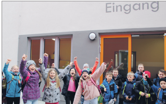
Mädchen und Jungen der Grundschule Greiz-Pohlitz bejubeln beim ersten Besuch ihr neues eigenes Schulgebäude. Seit Ende April lernen sie nun hier.