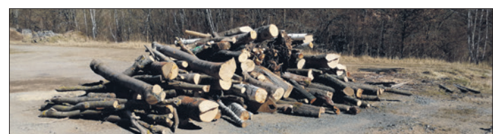
Das in Zeulenroda (oben) bzw. Bad Köstritz zu erwerbende Holz.